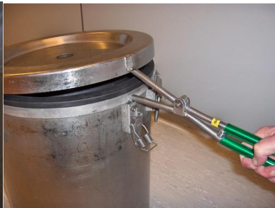
Speciaal gereedschap om RVS container te openen

NB: Na aangetoonde/gedocumenteerde inactivering/destructie van de inhoud van de RVS container, dus na controle of de gekleurde kunstof smeltdop correct gesmolten is, mag de inhoud afgevoerd worden in de rode rolcontainer of container met rode deksel (zie punt 6). Bij constatering van afwijkingen direct de BSO/BVF waarschuwen.