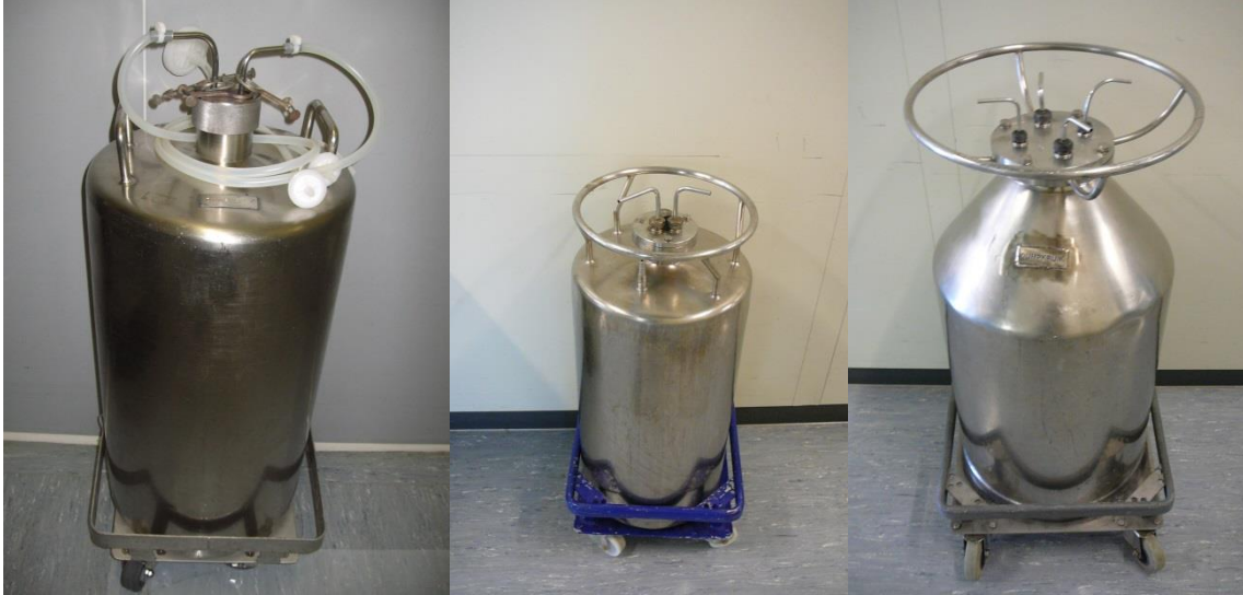
90 L uitvoering