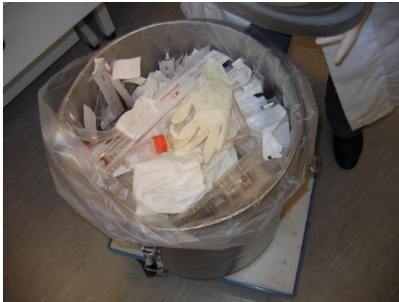
RVS container met krimpzak en niet homogene inhoud

De autoclaafoperator neemt de RVS-afvalcontainer over, plaatst deze in de autoclaaf en start het destructie proces. Bij aflevering wordt de RVS-afvalcontainer direct beoordeeld en bij afwijkingen worden direct maatregelen getroffen en de BVF ingeschakeld voor advies. Er is bij de autoclaaf geen tussenopslag van deze categorie afval.