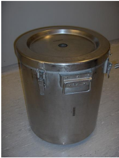
RVS container voorzien van barcode op deksel en vat