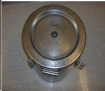
RVS container bovenzijde