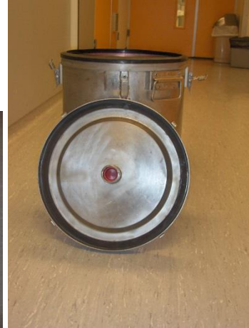
Deksel RVS container onderzijde (siliconenrubberrand en gekleurde plopdop)

RVS-containers zijn metalen containers met een inhoud van 40 liter. De RVS-container weegt leeg circa 11 kg. Het deksel wordt op de container geklemd met vier klemmen. Gebruik na het terugklappen van de klemmen, het speciale gereedschap om het vat te openen, verkrijgbaar via Logistiek centrum van PSP. Gebruik geen schroevendraaier, dit kan de rand beschadigen en de container onbruikbaar maken! De rand van siliconenrubber zorgt voor optimale afsluiting tijdens transport. De RVS-container is geschikt voor het vervoeren van afval met BA tot en met categorie 3 (inclusief polio en vaccinia) en GGO's tot en met inperkingsniveau III, naar de autoclaaf/destructor. Voor afval met categorie 3 (inclusief polio en vaccinia en GGO's met inperkingsniveau III) geldt, dat de autoclaaf in het gebouw aanwezig moet zijn.